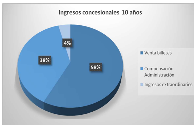
Gráfico 2: Distribución de los Ingresos concesionales en los 10 años.

Con base en todo lo anterior, la estructura de ingresos de la concesión queda recogida en el siguiente gráfico: